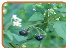
ناج ریزی سیاه